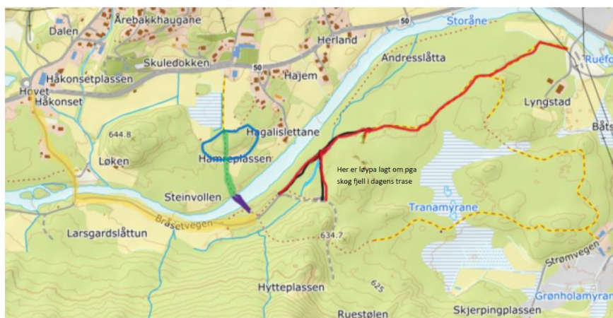
Prosjekt utvidelse lysløype Hovet alt 2