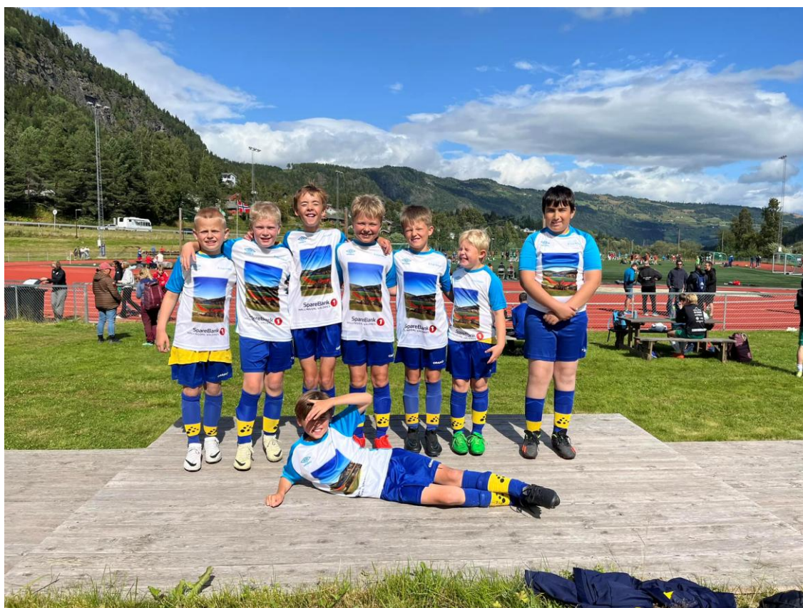
7'er laget til Hol på Ål-cup helga før skolestart!