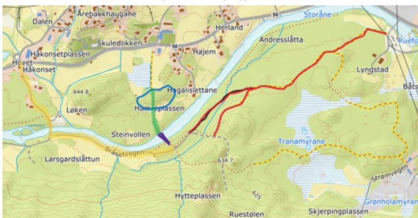
Prosjekt utvidelse lysløype Hovet

Prosjektet skal kjøres som spillemiddelprosjekt og tiltaket med bro har fått prioritet. Forslaga under er på tegnebrettet og endringer kan skje etter at fylket og grunneiere har sett på prosjektet.