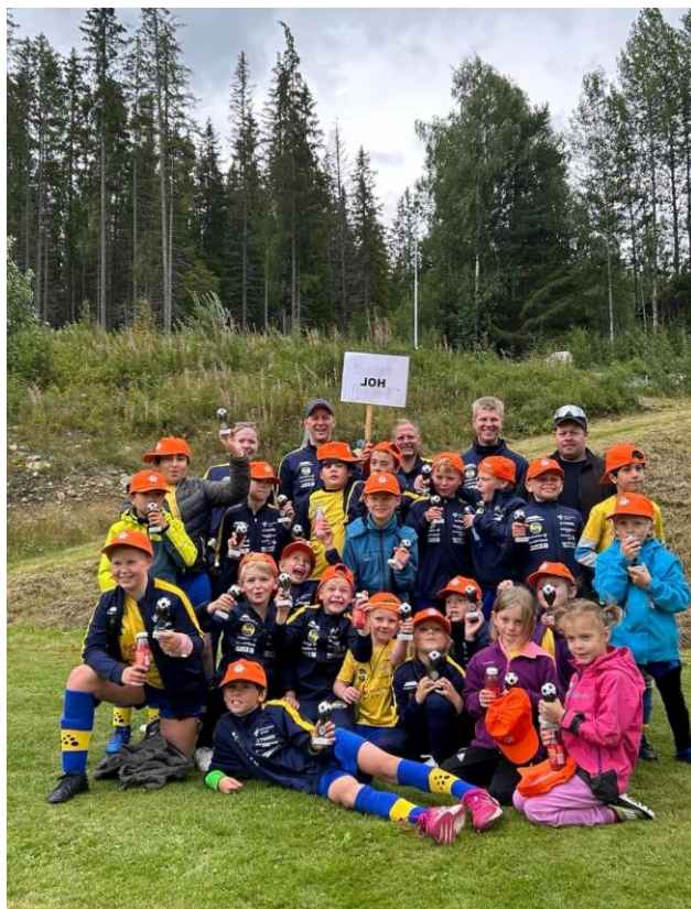
Fornøyde spillere fra Hol på Torpocup i august.